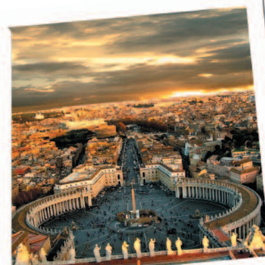
Itália | Roma