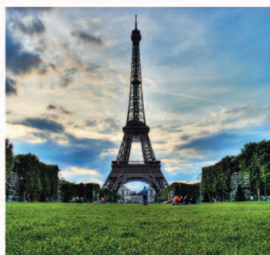
França | Paris